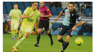
FOOTBALL. Ligue 2 : Le HAC - Brest